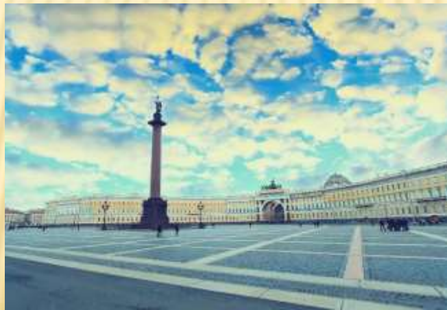
Осадчая Д.Е. «Наш город Санкт -Петербург»