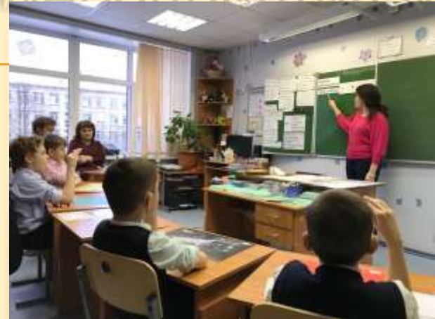
Романец Т.Р. «Узор. Городецкая роспись»