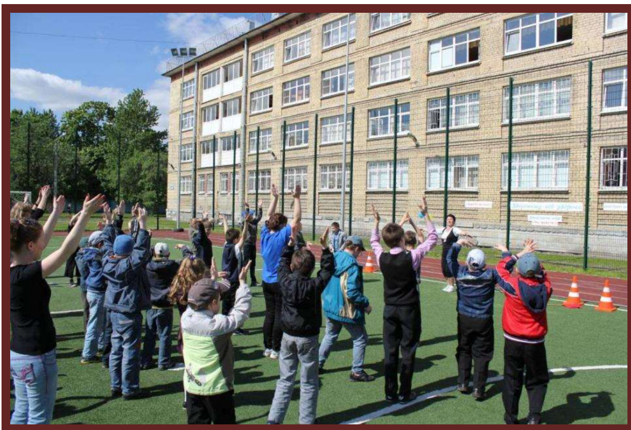
Стадион. Спортивные занятия