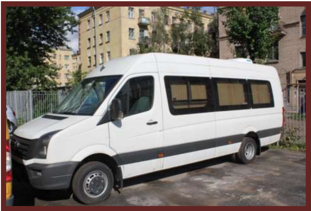
Новый школьный автобус на базе Volkswagen