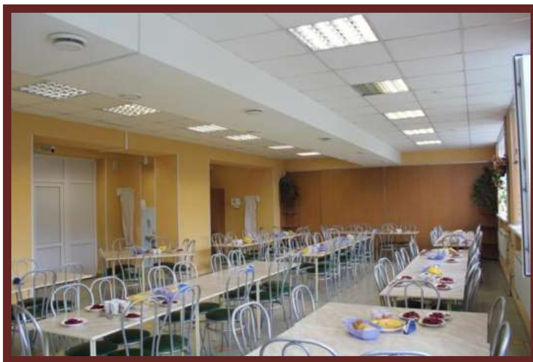
Рисунок 1 Столовая школы

Столовая, после проведенного капитального ремонта, соответствуют всем требованиям Роспотребнадзора.