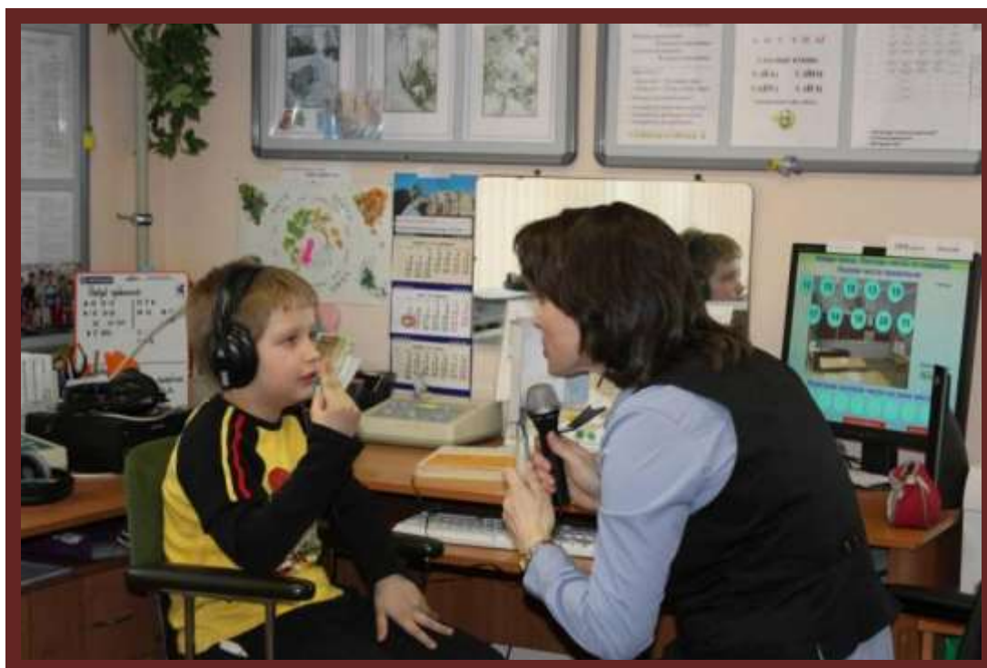
Индивидуальное занятие с использованием компьютерной техники

4. Проведен интернет во все учебные помещения с установкой компьютеров.