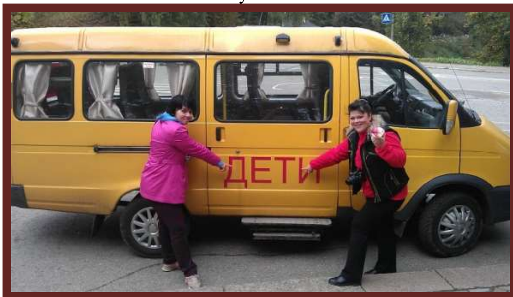
Школьный автобус на базе Газель

Экскурсионные поездки и выезды на районные и городские мероприятия осуществляются на школьных автобусах.