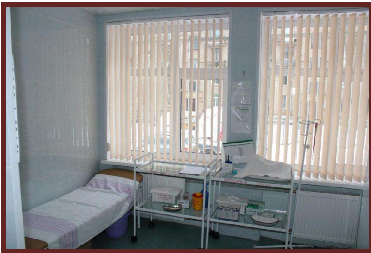
Рисунок 2 Медицинский блок. Процедурный кабинет

профилактическую работу, с учетом их возрастных и индивидуальных особенностей специалистами Образовательного учреждения и района.