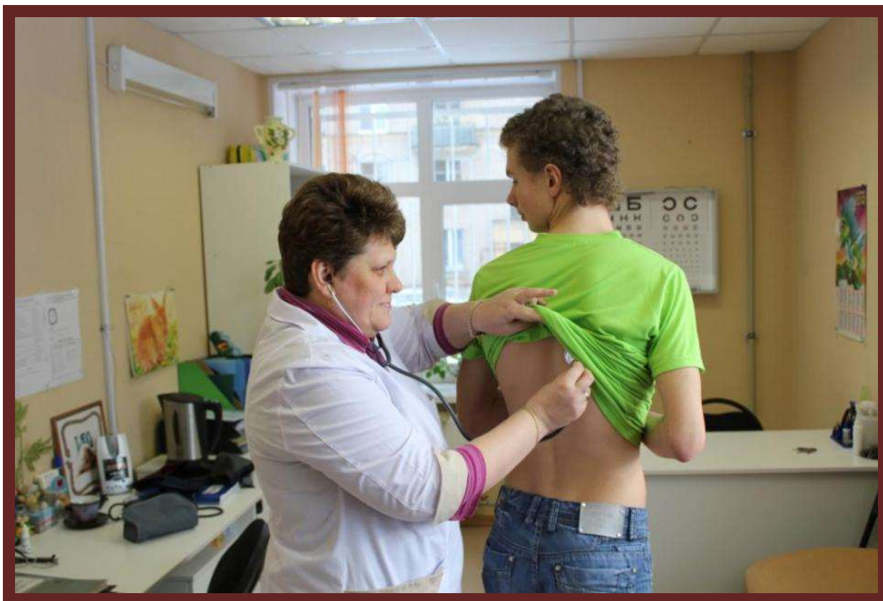
Рисунок 3 Медицинский блок. Кабинет врача