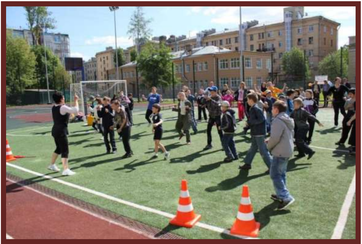
Праздник «Веселые старты»

2. Отремонтированы цоколь и отмостка здания.